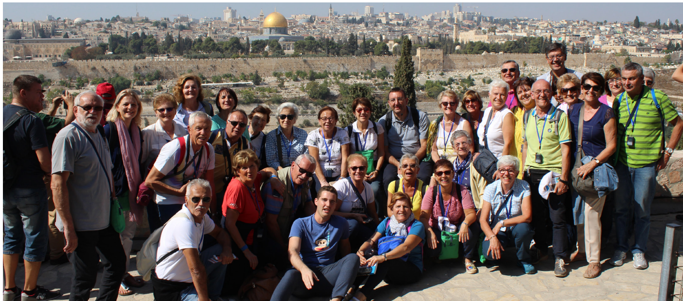
I partecipanti al viaggio organizzato nel mese di ottobre

L'esperienza del pellegrinaggio comunitario in Terra Santa