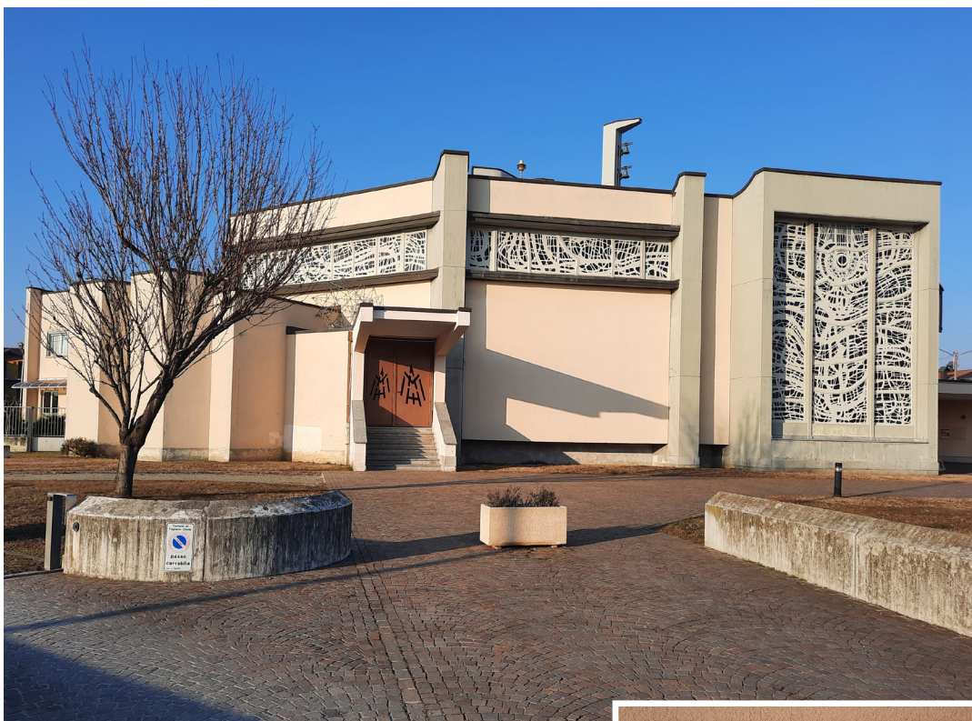
La prima pietra all'ingresso della chiesa di Santa Maria Assunta