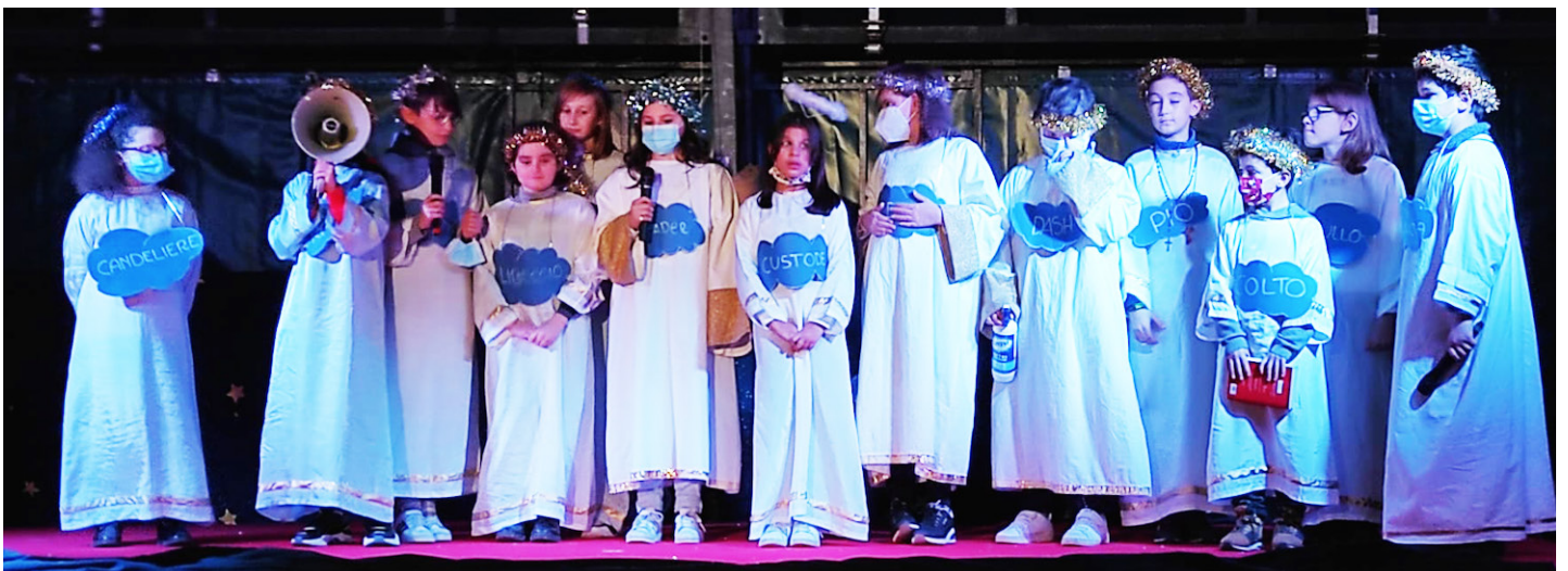
Un momento della suggestiva recita natalizia dei ragazzi al PalaFrassati