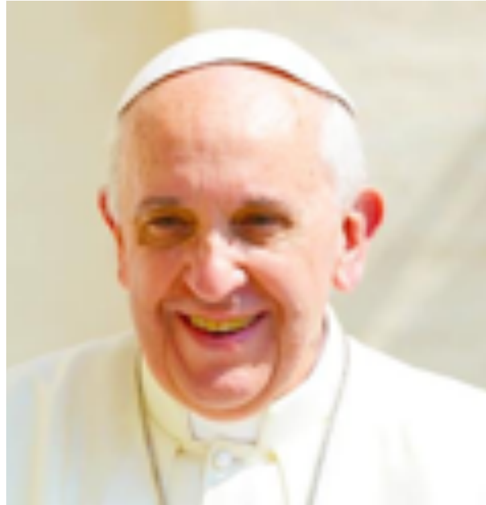
Papa Francesco richiama i fedeli a rivalutare la famiglia

giorno. Questa scoperta può dare ai vostri figli la fede e la capacità di confidare in Dio. Certo, educare i figli non è per niente facile. Ma non dimentichiamo che anche loro