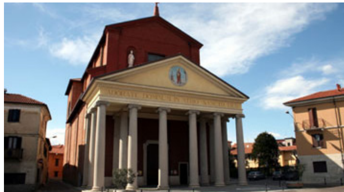
La chiesa parrocchiale di San Gaudenzio oggi in festa