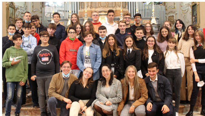
I ragazzi che hanno fatto la Professione di Fede in San Gaudenzio

All'interno di questo viaggio, un momento molto intenso per me è stata la preghiera in chiesa vissuta la settimana prima della Professione di Fede: le luci soffuse, la musica e le candele che ardevano ad illuminare il Santissimo, sembrava davvero tutto molto magico, come se potessimo avvertire la presenza di Dio proprio in quel momento. Dopo aver fatto la Professione di Fede domenica, mi sono sentito molto più pieno e felice.