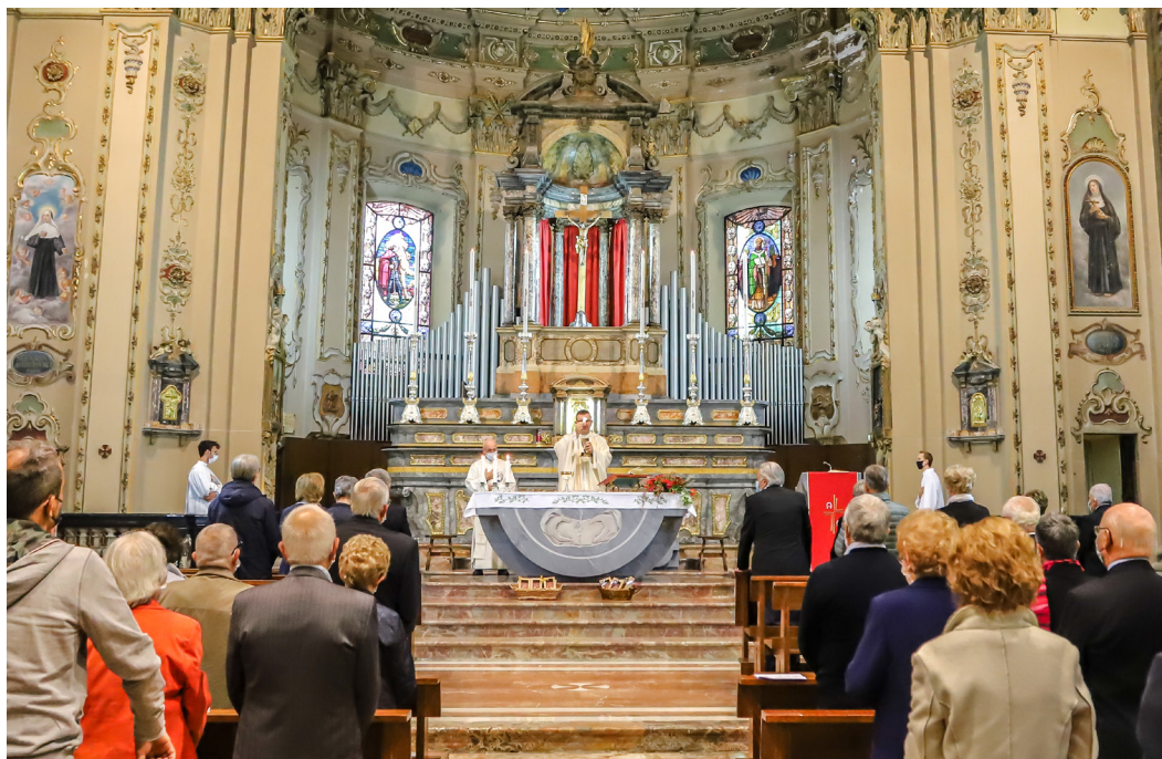
Coniugi e familiari uniti attorno all'altare ricordano i loro anniversari di nozze.

Provvidenza che ha fatto sì che capitassero letture del giorno appropriate senza neppure la fatica di cercarle e il momento del rinnovo delle promesse matrimoniali, sono stati il trampolino di lancio capace di creare il clima per una preghiera intensa e com-