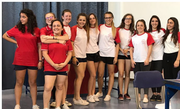
Ragazzi, squadre, allenatori e dirigenti del gruppo sportivo dell'oratorio fagnanese