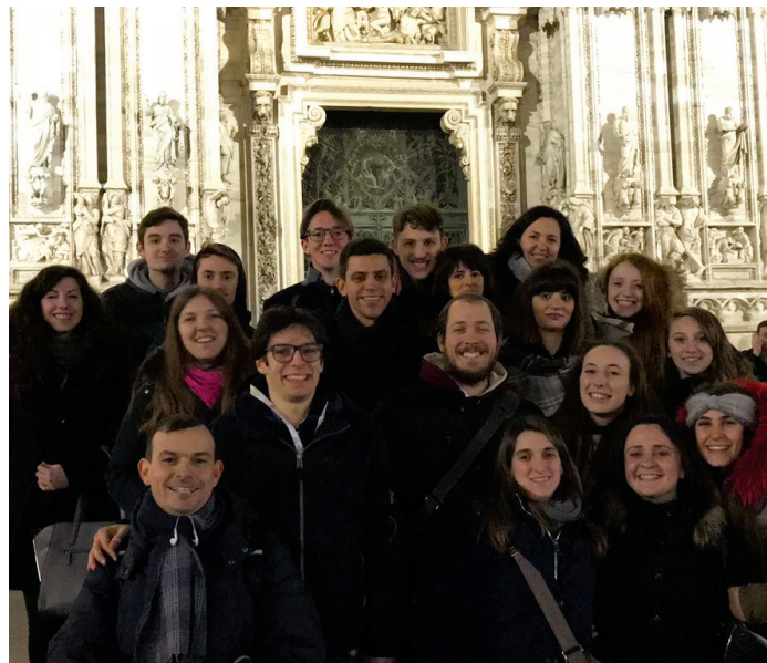
Il gruppo del coro davanti al Duomo dopo la celebrazione