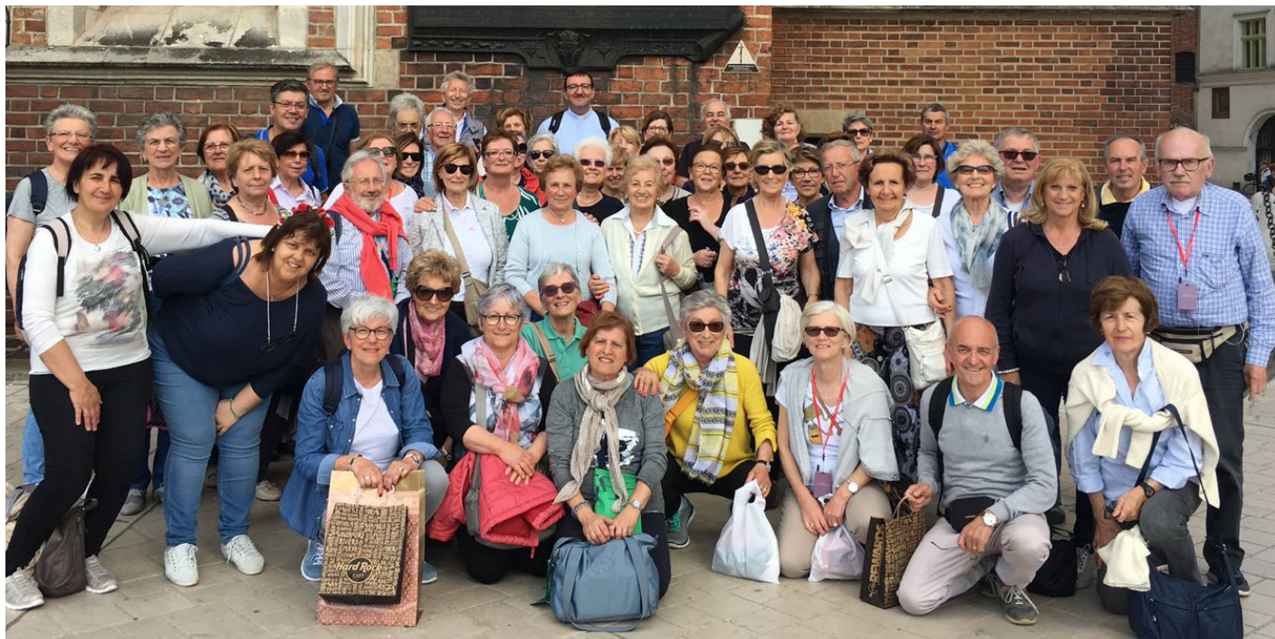
Il gruppo dei pellegrini fagnanesi con il parroco affascinati dalla storia e dalla cultura polacca. Hanno fatto tappa a Varsavia, Cracovia, Auschwitz e Czestochowa.

Don Federico guida i pellegrini sulle orme di papa Giovanni Paolo II